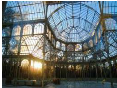
Palacio de cristal