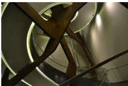
Espacio Fundación Telefónica.